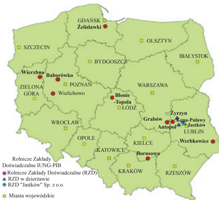
Rys. 1. Lokalizacja Rolniczych Zakładów Doświadczalnych IUNG-PIB

Istniejący w IUNG-PIB i systematycznie wzbogacany zintegrowany system informacji o przestrzeni rolniczej charakteryzuje się dużą reprezentatywnością i umożliwia wykonywanie szeregu map numerycznych o różnej skali i zasięgu terytorialnym, przydatnych do zarządzania przestrzenią rolniczą. W latach 2011-2015 Instytut realizował program wieloletni pt. „Wspieranie działań w zakresie kształtowania środowiska rolniczego i zrównoważonego rozwoju produkcji rolniczej w Polsce”, ustanowiony przez Radę Ministrów. Natomiast obecnie IUNG-PIB realizuje program wieloletni pod nazwą „Wspieranie działań w zakresie ochrony i racjonalnego wykorzystania rolniczej przestrzeni produkcyjnej w Polsce oraz kształtowania jakości surowców roślinnych” na lata 2016-2020 na mocy Uchwały 223/2015 Rady Ministrów z dnia 15 grudnia 2015 r. (13).