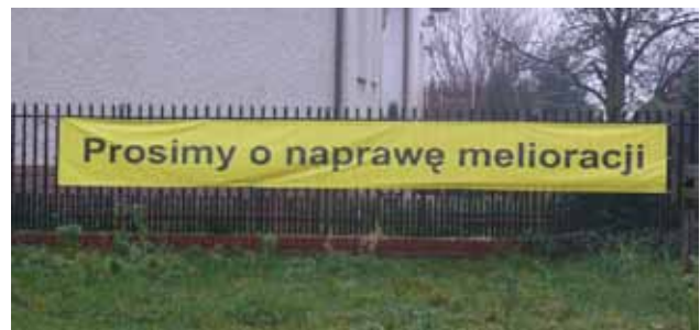
Fot. 1. Apel mieszkańców domów z zalanymi piwnicami o naprawę melioracji

Powódzie i podtopienia dotyczą nie tylko dolin dużych rzek. Są one dotkliwe w dolinach małych rzek oraz na obszarach pozadoliniowych. Przykładem tego może być obszar szybko urbanizujących się podwarszawskich Falent, gdzie niesprawne systemy drenarskie powodują podtopienia gruntów ornych. Podtopienia te przenoszą się na pobliskie zabudowania mieszkaniowe. Na fotografii 1 przedstawiono baner wywieszony przez mieszkańców osiedla mieszkaniowego, poprzez który proszą o pomoc w naprawie systemów drenarskich.